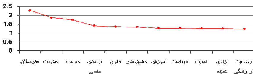
جدول ۲. جمع‌بندی دور پنجم