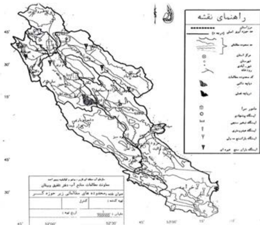
شکل ۱. نمایی از موقعیت حوضه آبریز رود کر و موقعیت جغرافیایی ایستگاهها (مطالعات پایه، ۱۳۷۹).

در حوضه‌های مرتفع برفگیر، ماه‌های با بیشترین جریان رود تاخیر زمانی دو ماهه‌ای با ماه‌هایی با بیشترین بارندگی دارند. در این حوضه‌ها بیشترین بارندگی در زمستان به صورت برف نازل شده و زیادترین جریان رود مربوط به بهار می‌باشد. این تاخیر زمانی به علت اختلاف زمان نزول برف و ذوب آن است. حوضه‌های رودهای شور