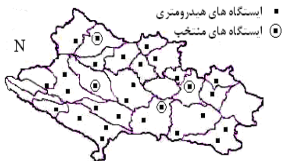
شکل ۲- محدوده واحدهای هیدرولوژیکی و موقعیت ایستگاه‌های هیدرومتری و منتخب مورد مطالعه.