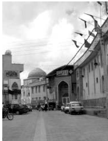
شکل ۳- تسهیل مسیریابی با دسترسی دیداری (دید به آرامگاه بی‌بی دخترن)

مسیریابی متقارن و نامتقارن نیز از زمره عناصری است که در نقشه‌های شناختی از اهمیت زیادی برخوردارند. این مسأله