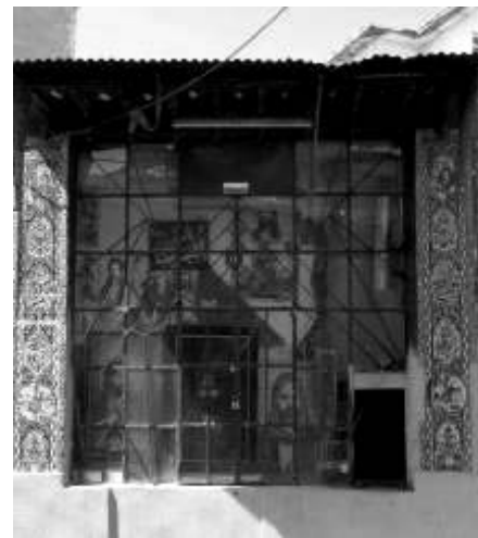
شکل ۱- نشانه‌های محلی آشنا برای کمک مسیریابی موفق (سقاخانه و محلی برای روشن کردن شمع)