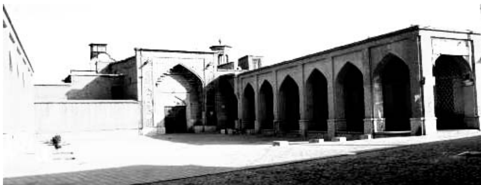
شکل ۲- میدان و مسجد مشیر از شاخص‌های منطقه