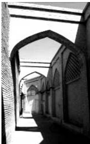
شکل ۲- ساباط پشت مسجد، تمایزهایی که در جداره و همراه با سایه‌روشن ایجاد شده، به مسیریابی موفق کمک می‌کند