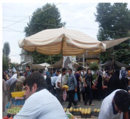
بازار دوره ای محلی پره

تصویر ۱- نمایی از دو بازار دوره ای محلی در گیلان