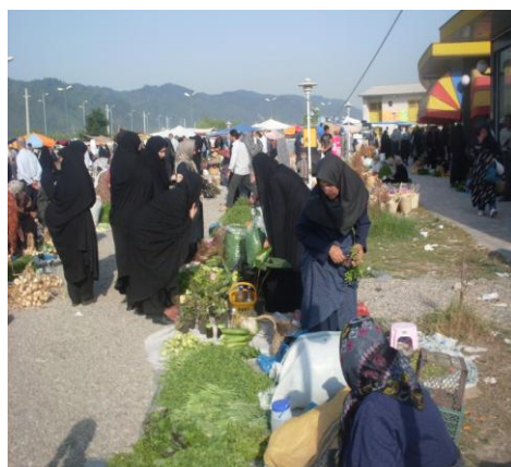
بازار دوره ای محلی