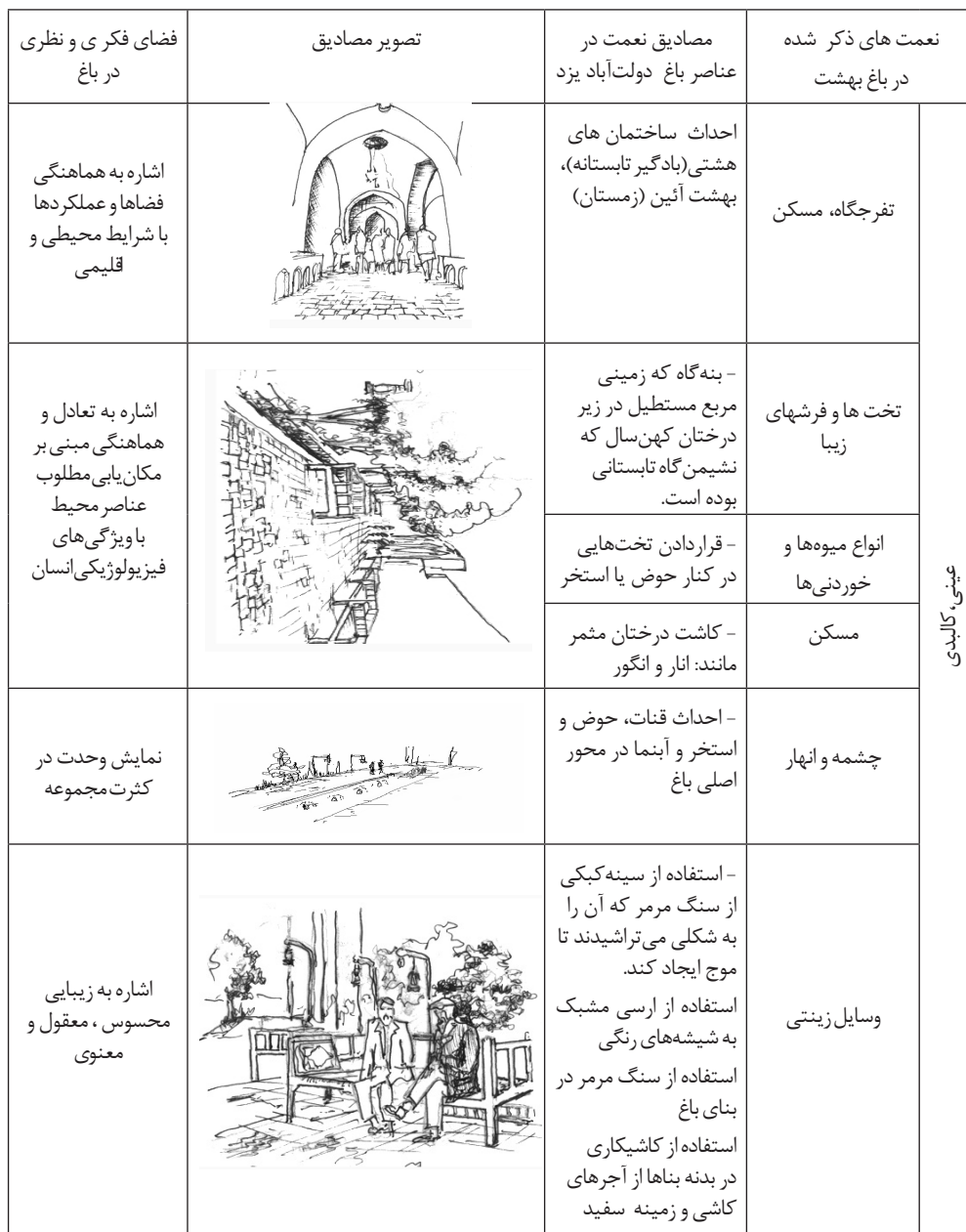
جدول ۳- بازخوانی عناصر در بهشت قرآنی و باغ دولت آباد