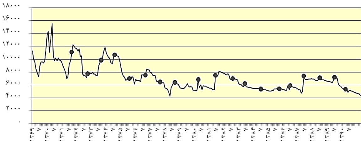
نمودار ۱. قیمت ماهانه خرما در سطح تولیدکننده با قیمت های ثابت سال ۱۳۸۳

داده های روزانه جو و گندم (canola) و برای دوره ۱۹۸۹-۱۹۸۸، نسبت تأمین را بر اساس مدل Garch تعیین کرد. Baillie & Myers (1991) با استفاده از داده های روزانه برای دوره ۱۹۸۶-۱۹۸۲ برای کالاهای گوشت گاو، قهوه، ذرت، پنبه، طلا و سویا، با استفاده از مدل Bgarch، نسبت تأمین حداقل واریانس را تعیین کردند. نتایج این مطالعه نشان داد نسبت های تأمین استخراج شده از مدل Garch به طور معنی داری بهتر از نسبت های تأمین ثابت است. مدل های Arch، Garch، Bgarch به طور وسیعی برای تعیین نسبت های تأمین متغیر طی زمان استفاده شدند. در زمینه کالاهای آتی می توان به مطالعه Baillie & Myers (1991) و Myers (1991) و در زمینه نرخ ارزهای خارجی به مطالعه Kroner & Sultan (1993) و در زمینه نرخ های بهره آتی به مطالعه Gagnon & Lypny (1995) و در زمینه ذخایر آتی به مطالعه های Park & Switzer (1995) و Tong (1996) اشاره کرد. نسبت تأمین شرطی برای مثال در مطالعه Miffre (2004)، Lien et al. (2002)، Brooks et al. (2002)، Garcia et al. (1997)، Bera, et al. (1995)، Park & Switzer (1995)، Sephton (1993)، Kroner & Sultan (1993)، al. (1995)، Cecchetti (1988)، Malliaris & Urrutia (1991)، Engle, et al. (1982)، Bollerslev (1986)، (1979) و Ederington استفاده شد. در حالی که Lien et al. (2002) و