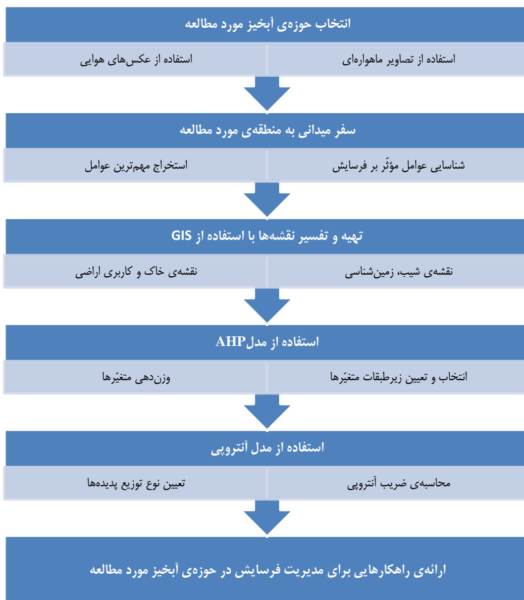
شکل ۲. فرآیند روش پژوهش

بررسی میزان فرسایش در هر منطقه، نیازمند شناسایی متغیرهای تأثیرگذار بر فرسایش در آن منطقه است و متغیرهای قابل محاسبه در مدل آنتروپی، برای مشخص کردن فرسایش حوضه‌های آبخیز و مدیریت آنها بسیار زیاد هستند؛ بنابراین پنج متغیر شیب زمین، جنس زمین، خاک، پوشش گیاهی و سطوح انسان‌ساخت، به‌عنوان مهم‌ترین عوامل مؤثر بر فرسایش انتخاب شدند. روش کار در پژوهش حاضر در چارچوب نمودار در زیر ارائه می‌شود.