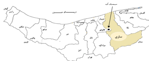
شکل ۱- موقعیت منطقه مورد مطالعه

بر این اساس و به منظور شناسایی علت گرفتگی تحقیق حاضر انجام شد. با توجه به اهمیت کارکرد قطره‌چکان‌ها در افزایش و یا کاهش شاخص‌های