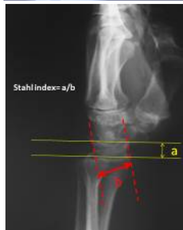
شکل ۳. روش اندازه‌گیری «ایندکس استال» نسبت ارتفاع لونیت به عرض آن که در نمای نیم‌رخ اندازه‌گیری می‌شود. در این تصویر a ارتفاع لونیت و b عرض لونیت را نشان می‌دهد.