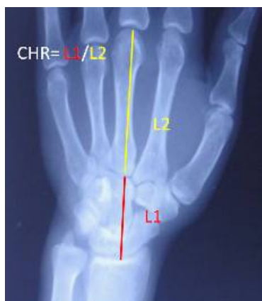
شکل ۲. روش اندازه‌گیری نسبت ارتفاع میج به متاکارپ را نشان می‌دهد که اندازه آن ۳ می‌باشد.