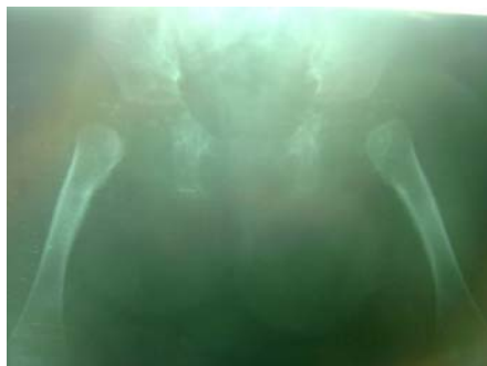
شکل ۳. پرتونگاری ساده لگن در سن ۱۰ ماهگی که همچنان دررفتگی مفصل ران دو طرف را نشان می دهد.

شکل ۱. پرتونگاری ساده لگن در سن ۴ ماهگی که کلسیفیکاسیون های منقوط پروگزیمال فمورها و قرارگیری آنها در بالا و خارج تر استابولوم را نشان می دهد.