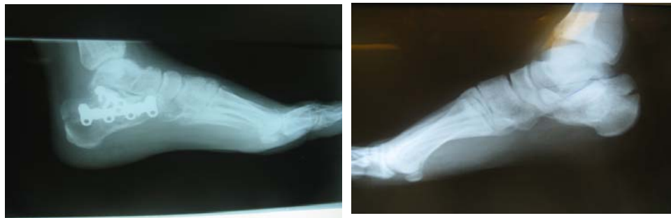
شکل ۲. نمای کناری پای بیمار دیگر قبل و بعد از عمل جراحی