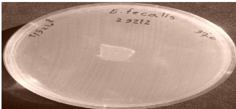
تصویر ۳- عدم رویت هاله‌ی عدم رشد در انتروکوکوس فکالیس (ATCC25922).