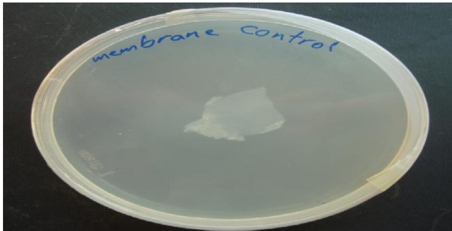
تصویر ۴- کنترل غشاء آمینوتیک از نظر عدم آلودگی