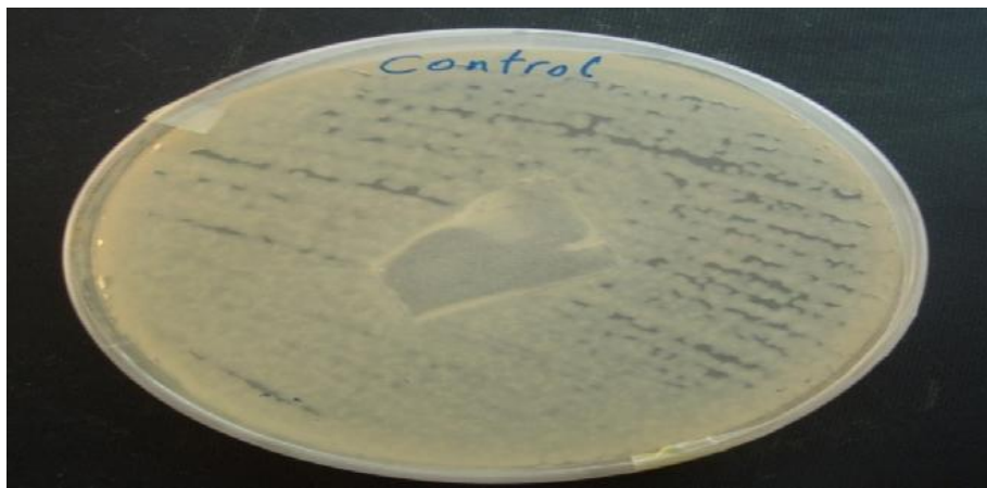
تصویر ۵- کنترل منفی توسط غشاء نیتروسلولزی کلنی‌های باکتریایی در سراسر محیط کشت حتی در زیر غشای نیتروسلولزی مشاهده می‌گردند.