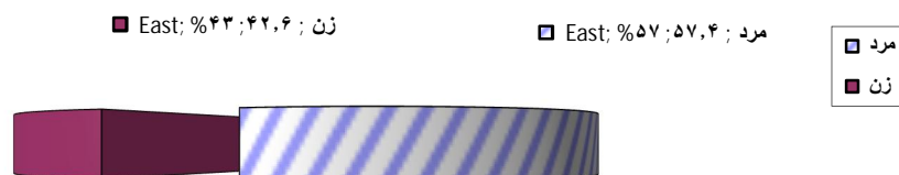
نمودار شماره (۲): توزیع فراوانی نسبی جمعیت مورد مطالعه برحسب جنس