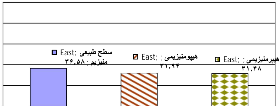
نمودار شماره (۴): توزیع فراوانی نسبی سطح منیزیم در جمعیت مورد مطالعه