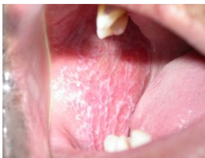
شکل شماره (۱): ضایعات پوستی به صورت نمای Blaschko در گونه بی‌مار

در معاینات داخل دهانی نبودن تعدادی دندان مشاهده شد (شکل ۴) و رادیوگرافی جهت بررسی تکامل جوانه دندان‌دانی صورت گرفت (شکل ۵). در رادیوگرافی پانورامیک، دندان‌های پره مولر، سانترال پائین و مولرهای دوم غائب بود (شکل ۶). تشخیص بر اساس یافته‌های کلینیکی، تاریخچه و رادیوگرافی انجام گرفت.