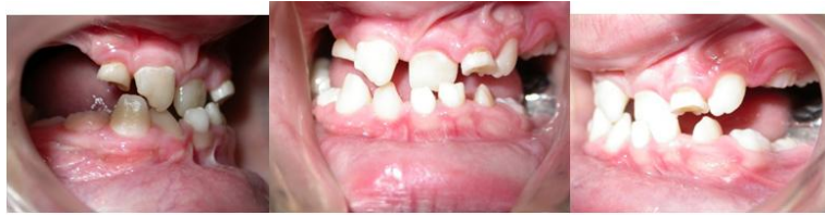
شکل شماره (۴): وجود دندان‌های های‌پوپلاستی‌ک و عدم وجود دندان‌های دای‌می سانترال سمت چپ