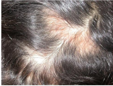
شکل شماره (۳): آلوپیشی در اسکالپ بی‌هار