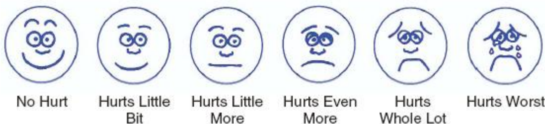
شکل (۱): موفقیت علامتی بیماری (Symptomatic score) به عنوان کاهش قابل ملاحظه درد تعیین شد.

یکی از روش‌های درمان کیست ساده کلیه، آسپیراسیون پر-کوتانئوس، با یا بدون تزریق مواد اسکروزان می‌باشد. در این روش ممکن است عود کیست داشته باشیم (۶) و نیز عوامل اسکروزان ممکن است موجب سپسیس و آنفیلاکسی شود (۷) و در مواردی نیز فیستول‌های شریانی- وریدی ایجاد می‌شوند، مواردی که تکنیک جراحی پرکوتانئوس ناموفق بوده، نهایتاً منجر به جراحی باز دکورتیکاسیون کیست کلیه شده‌اند. این روش‌ها با وجود مؤثر و بودن ممکن است همراه با عوارض قابل توجه در هنگام عمل و بعد از عمل و نیز بستری طولانی مدت در بیمارستان باشد (۸). اخیراً با ظهور لاپاراسکوپیک و گسترش استفاده از آن در ارولوزی، انجام لاپاراسکوپیک در کیست‌های علامت‌دار، بسیار مؤثر و همراه با کمترین عوارض، کاهش زمان جراحی، کاهش خونریزی و کاهش زمان بستری شده (۹) و به عنوان روش انتخابی جراحی به کار می‌رود (۱۰).