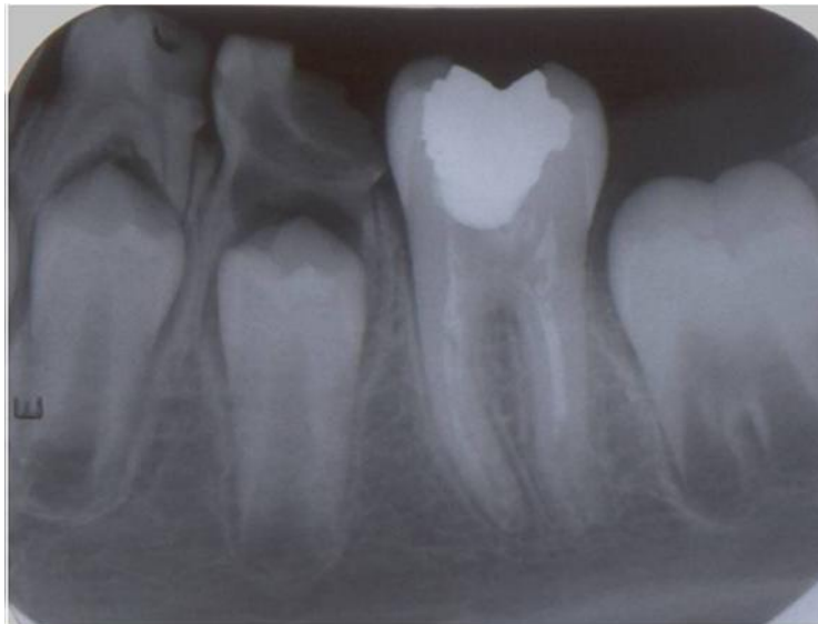
شکل (۳): تصویر پری آپیکال دندان یکسال پس از درمان که نشان دهنده تکامل ریشه می باشد.