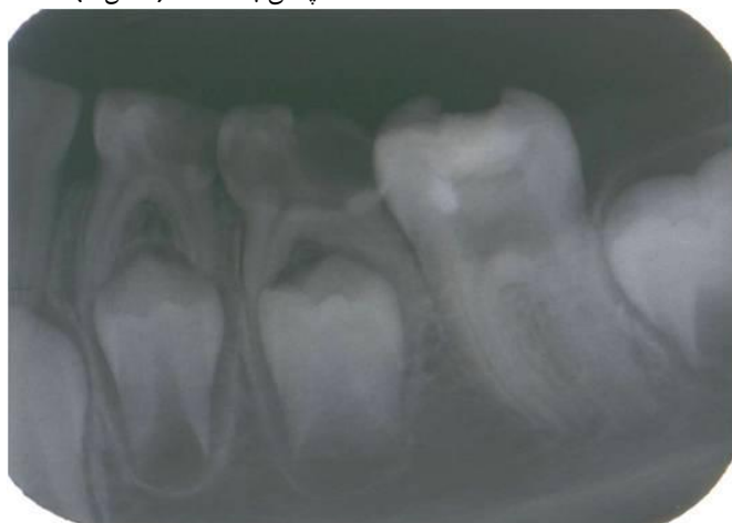
شکل (۱): دندان مولر اول مندیبل با پوسیدگی وسیع تاجی و ریشه نابالغ نکروز

از آنجاییکه در روش‌های سنتی درمان دندان‌های نابالغ مانند آپکسیفیکیشن بدلیل عدم تکامل ریشه و نازک بودن دیواره‌های عاجی احتمال شکستگی ریشه بسیار بالاست، فراهم کردن شرایطی که ریشه دندان روند تکامل خود را طی کند و ریسک شکستگی ریشه و در نهایت از دست دادن کامل دندان کاهش یابد، نظیر درمان‌های رژئراسیون از اهمیت بسیاری برخوردار است. هدف از این گزارش مورد، القاء تکامل ریشه مولر اول دائمی نابالغ با