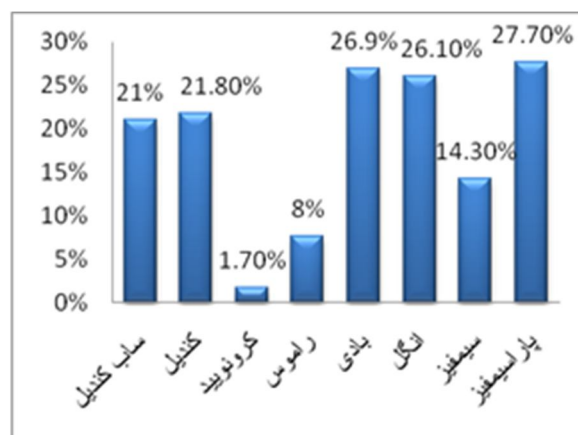
نمودار (۲): توزیع نواحی شکستگی مندیبل در بیماران مراجعه‌کننده به بیمارستان شهید بهشتی

نیمه‌ی میانی صورت ۱۹۷ مورد از کل شکستگی‌ها را شامل می‌شود که بعد از بینی با ۱۰۵ مورد (۵۳/۳ درصد)، ZMC با ۲۳/۹ درصد شایع‌ترین محل شکستگی بوده است و بعد از آن اربیت با ۲۱/۸ درصد سومین محل شایع می‌باشد. شکستگی مندیبل شامل ساب کندیل، کندیل، کروئوئید، راموس، بادی، انگل، سمفیز بوده است و ۱۱۹ مورد از ۳۱۱ شکستگی را به خود اختصاص داده است که از این میان شکستگی