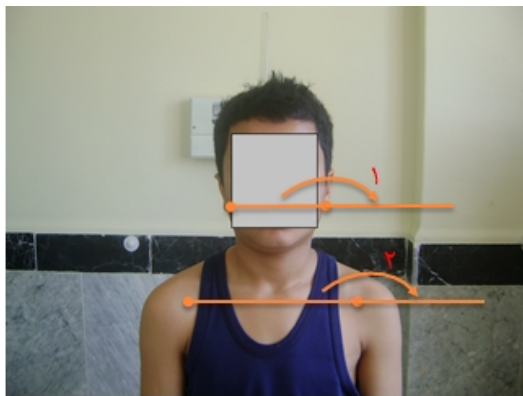
شکل ۲: روش اندازه‌گیری کج گردنی و شانه نابرابر (۱) زاویه کج گردنی، (۲) زاویه شانه نابرابر