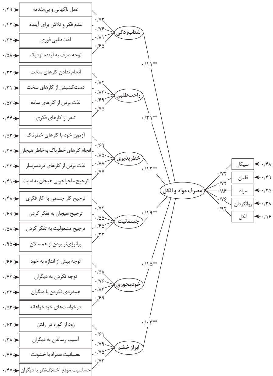
شکل ۲: مدل معادلات ساختاری عوامل موثر بر مصرف مواد و الکل