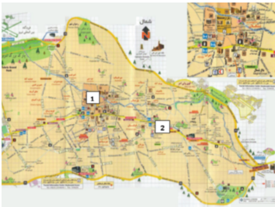
شکل ۱: نقشه شهر تبریز و موقعیت ایستگاه های اندازه گیری صدا

این پژوهش یک مطالعه از نوع توصیفی - مقطعی است. هدف از اندازه گیری آلودگی صدا در نقاط پرتراфик شهر تبریز مشخص نمودن وجود آلودگی صوتی در این شهر است. لذا ۲ نقطه شلوغ، پرتراфик و حساس شهر تبریز از نوع منطقه تجاری و تجاری- مسکونی برای این موضوع انتخاب گردید و روزانه در ۳ نوبت صبح (از ساعت ۷/۳۰ الی ۹/۳۰)، ظهر (از ساعت ۱۲/۳۰ الی ۱۴/۳۰) و شب (از ساعت ۱۹ الی ۲۱) مطابق روش اعلام شده از سوی سازمان EPA و به طور همزمان در دو ایستگاه منتخب انجام گرفته و بر حسب دسی بل در فرم های طراحی شده برای این منظور ثبت گردید. این اندازه گیری ها به مدت یک ماه تداوم یافت، به طوری که در هر یک از روزهای ایام هفته حداقل ۴ مرتبه سنجش در سه بازه زمانی مشخص شده صورت گرفته و در مجموع ۱۸۰ رکورد در طی این یک ماه نمونه برداری به دست آمد. داده های حاصل با استفاده از آمار توصیفی نرم افزار SPSS، مورد تجزیه و تحلیل آماری قرار گرفته و نمودارها در نرم افزار Excel رسم شدند. تراز معادل فشار صوت در ایستگاه ها با استانداردهای مربوط به صدا در هوای آزاد ایران به صورت روزانه (۷ صبح الی ۱۰ شب) مورد مقایسه قرار گرفت.