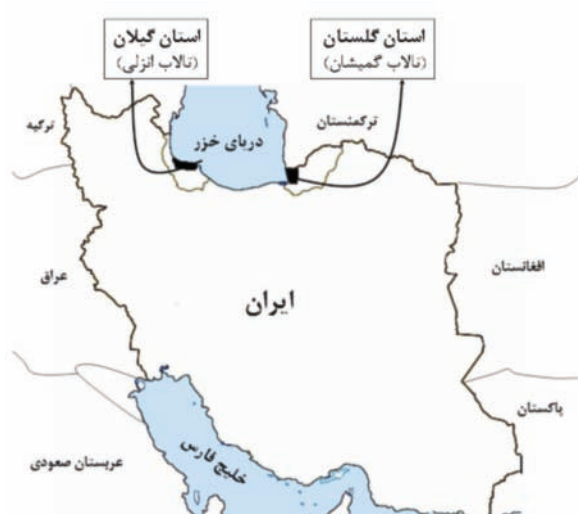
شکل ۱: نمایش منطقه مورد مطالعه

عمدتا ورود جیوه و مشتقات آن به بدن انسان، از طریق مصرف مواد غذایی و آبزیان صورت می گیرد (۱۰). میانگین غلظت جیوه در بافت های مورد مطالعه به صورت جدول زیر می باشد (جدول ۱). نتایج نشان می دهند میزان جیوه در کبد همه گونه ها، به جز چنگر بیشتر از سایر بافت ها است. دلیل اصلی این موضوع به نقش کبد در فرایند متیلاسیون جیوه و درصد چربی بیشتر این بافت نسبت سایر بافت های داخلی در این دو گونه برمی گردد (۷). در چنگر به دلیل این که از یک طرف در سطح غذایی پایین تری قرار گرفته و از طرف دیگر رژیم غذایی این گونه کمتر مواد آلوده به جیوه دارد، همچنین درصد چربی بافت های آن نسبت به دو گونه دیگر کمتر بوده و طول عمر بسیار کمتری دارد، لذا میزان جیوه بیشتر در پرتجمع یافته است. همچنین عضله این گونه کمترین میزان جیوه را نسبت به همه بافت ها در هر سه گونه داشته است.