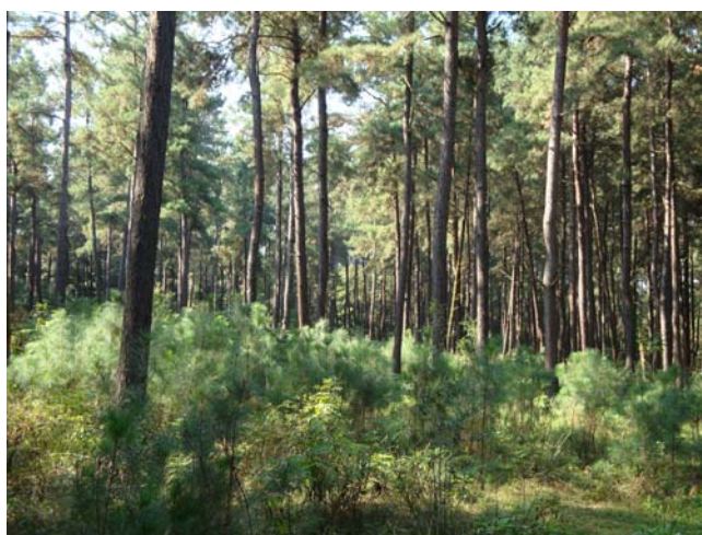
شکل ۳- توده جنگلی کاج تدای دوآشکوبه در محل اجرای تحقیق، پیلمبرا، گیلان