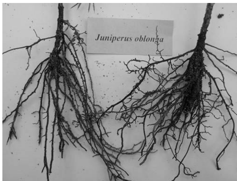
شکل ۲- ریشه‌دار شدن قلمه‌های Juniperus oblonga