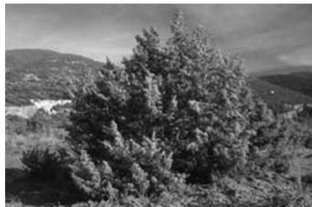
شکل ۱- نمایی از فرم ایستادهٔ Juniperus oblonga

سردهٔ ارس ( Juniperus ) از معدود سوزنی‌برگان ایران به‌شمار می‌آید که بعد از بنه بیشترین پراکنش را در میان درختان بومی ایران دارد. این درختان ارزش اقتصادی و حفاظتی بسیار دارند و در سخت‌ترین شرایط به‌ویژه از نظر بستر خاک مستقر شده‌اند (کروری و خوشنویس، ۱۳۷۹). به‌طور کلی ارس‌های ایران به دو گروه ارس‌های ایستاده و خزنده تقسیم می‌شوند. ارس‌های خزندهٔ ایران، J. sabina و J. communis و ارس‌های ایستادهٔ ایران، J. excelsa ، J. foetidissima و J. polycarpus هستند (ثابتی، ۱۳۵۵). یکی دیگر از گونه‌های ارس در ایران گونهٔ J. oblonga است که به هر دو صورت ایستاده و خزنده مشاهده می‌شود. این گونه درختچه‌ای است به ارتفاع ۱ تا ۴ متر و دوپایه با برگ‌هایی فراهم سه‌تایی، درفشی سوزنی، نوک باریک، به طول ۱۴ تا ۲۰ میلی‌متر و به‌ندرت کمتر تا ۱۲ میلی‌متر و پهنای ۱/۵ تا ۲ میلی‌متر؛ سطح رویی برگ‌ها نوار سفید رنگی دارد که اغلب تا نیمه یا تا نوک با رگه‌ای به دو قسمت تقسیم می‌شود. در روی شاخه‌های انتهایی در زیر محل اتصال برگ‌ها کیسه‌های صمغی وجود دارد. میوه تقریباً کروی به قطر ۳ تا ۱۰ میلی‌متر، به رنگ قهوه‌ای مایل به سیاه یا سیاه براق، گاهی کمی گرد و حاوی سه دانه است. رسیدن میوه در سال دوم یا سوم اتفاق می‌افتد. این گیاه متعلق به بخش کوهستانی ایران تورانی است (اسدی، ۱۳۷۶) (شکل ۱). محققان این گونه را بعد از کلیبر در منطقهٔ باغلار و در ارسباران در عاشقلو، ارمنی‌اولن و در خلخال در درهٔ اندبیل مشاهده کرده‌اند.