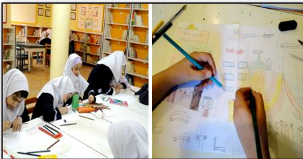
تصویر ۲. کودکان در حال طراحی محیط دلخواه خودشان، در محل کانون پرورش فکری کودکان قوچان.

Fig1. Justification of children in the "Child-Friendly City" (CFC) at the center of Intellectual Development of Children Quchan.