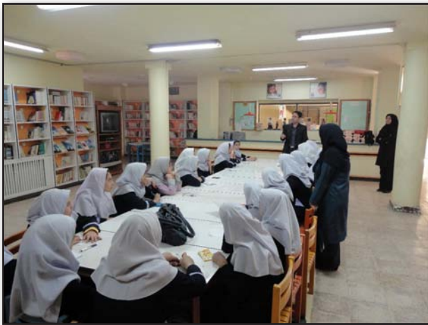
تصویر ۱. توجه کودکان در مورد شهر دوستدار کودک در محل کانون پرورش فکری کودکان قوچان.

Fig1. Justification of children in the "Child-Friendly City" (CFC) at the center of Intellectual Development of Children Quchan.