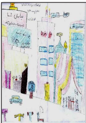
تصویر ۴. شهر مورد نظر کودکان.