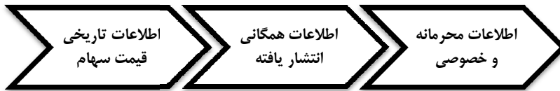
شکل ۲. سطوح مختلف سیستم اطلاعاتی بازار (الهیاری، ۱۳۸۷)

ناپارامتریک مرسوم در سنجش کارایی در سطح ضعیف، آزمون گردش هاست (Macy & Terry, 2010; Rozanova, 2010; Owens, 2010). یک گردش در روش اول عبارتند از توالی یکسان علائمی که به دنبال علائم مختلف یا بدون علامت می‌آید و در روش دوم، عبارتند از تغییر مقدار داده نسبت به میانگین (Mobarek & Keasey, 2008). آزمون گردش‌ها برای صنعت فاوا به هر دو طریق انجام گرفت.