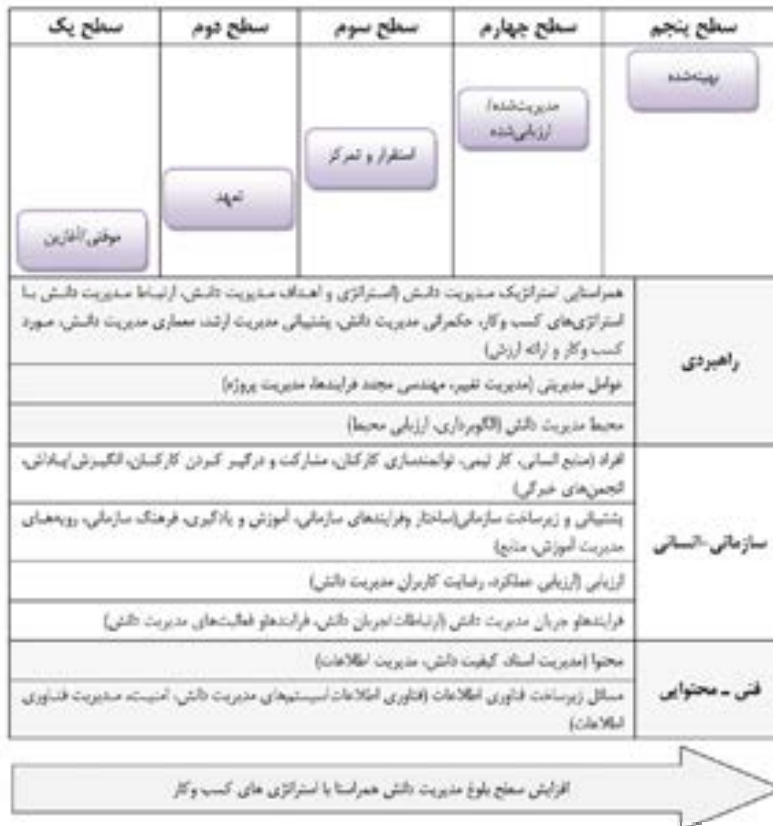
شکل ۲. مدل نهایی بلوغ مدیریت دانش همراستا با کسب و کار