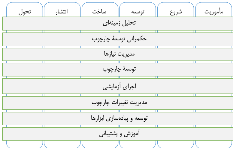
شکل ۱. شمای روش پیشنهادی

است. در پایان هر مرحله، پروژه در وضعیت خاص و جدیدی قرار می‌گیرد و چند شرط گذار ۱ خاص که برای آن مرحله در نظر گرفته شده است، محقق می‌شود.