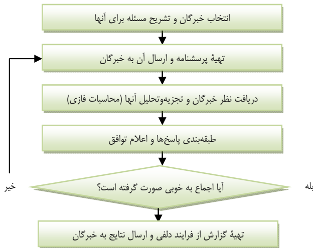
شکل ۱. الگوریتم اجرای روش دلفی فازی

الگوریتم اجرای روش دلفی فازی در شکل ۱ نمایش داده شده است.