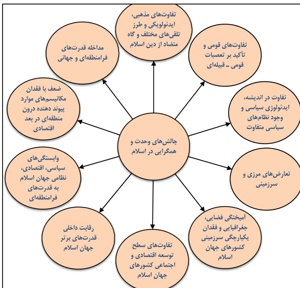
شکل ۲. عوامل و زمینه‌های واگرایی در جهان اسلام

مهم‌ترین عوامل و زمینه‌های واگرایی در جهان اسلام در قالب شکل زیر نشان داده شده است.