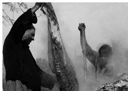
تصویر ۳- جوشاندن کرباس در دیگ، مرحله ثابت کردن رنگ پارچه.

هنرمندان برای تهیه رنگ سیاه از زاج سیاه و برای تهیه رنگ قرمز از زاج سفید استفاده