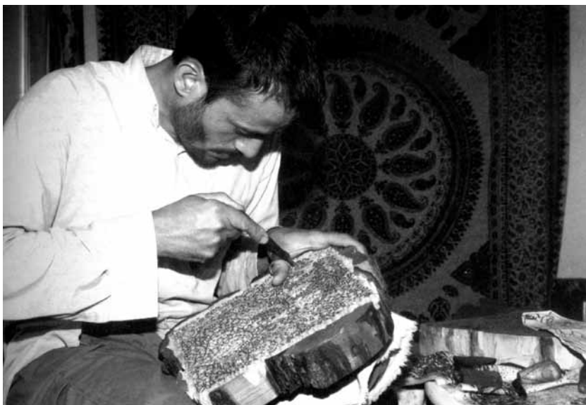
تصویر ۱- کندن نقوش بر روی چوب قالب توسط استاد کار.

در تصویر فوق (تصویر ۱) نیز استاد قلمکار در حال کندن نقوش گل و بته بر روی چوب است. در انتها نیز چوب های اضافی دور تا دور طرح ها را می برند و در پشت چوب، دسته ای برای قالب درست می کنند.