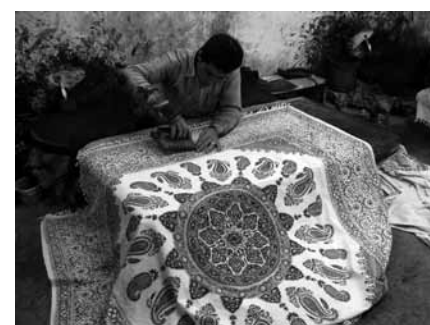
تصویر ۴- استاد چیت ساز در زمان کار بر پشت تخته.