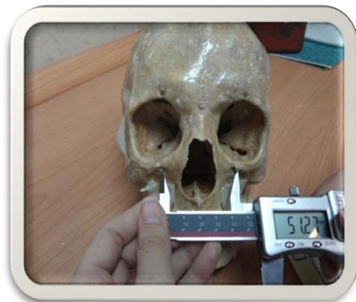
شکل ۱. اندازه‌گیری فاصله‌ی خطی بین دو نقطه‌ی آناتومیکی IOF-IOF توسط کولیس دیجیتال بر روی مجموعه خشک انسان (Infraorbital foramen: IOF)

اندازه‌گیری مستقیم بر روی مجموعه توسط کولیس دیجیتال دقیق (0-200mm, Guanglu, China) با دقت صدم میلی‌متر انجام گرفت (شکل ۱). کولیس بعد از هر بار استفاده کالیبره گردید و مجدداً روی نقطه‌ی صفر تنظیم شد. هر اندازه‌گیری سه مرتبه انجام گرفت و میانگین اندازه‌گیری‌ها محاسبه گردید.