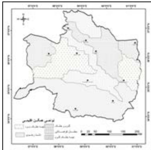
شکل ۱- پهنه‌بندی اقلیمی استان خراسان رضوی بر اساس روش‌های آماری (اسماعیلی و همکاران، ۱۳۹۰)