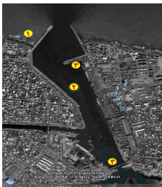
شکل شماره (۱): موقعیت ایستگاههای نمونه برداری در

بندر انزلی در بخش غربی سواحل جنوبی دریای خزر قدیمی‌ترین بندر ایران در این دریا بوده و بیش از ۱۲۰ سال از عمر آن می‌گذرد. این بندر در باریکه بین تالاب انزلی و دریای خزر قرار گرفته و دارای دو بازوی موج شکن سنگی است که حوضچه بندر را تشکیل می‌دهند (شکل شماره ۱).