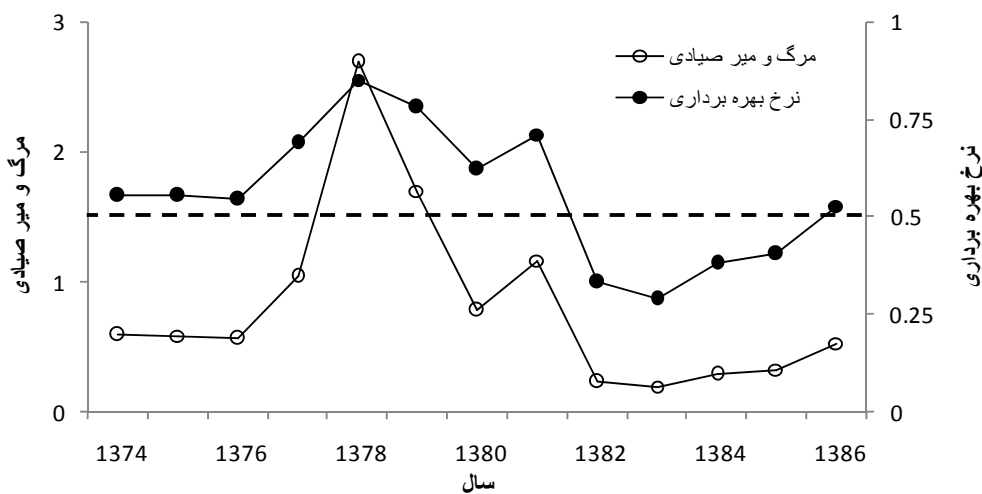
نمودار ۴: میزان مرگ و میر صیادی لحظه‌ای و نرخ بهره‌برداری از ذخایر کیلکای آنچوی در سواحل ایرانی دریای خزر طی سالهای ۱۳۷۴ تا ۱۳۸۶ (خط چین سطح مطلوب نرخ بهره‌برداری (یعنی ۰/۵) را نشان می‌دهد)