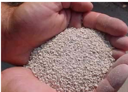
شکل ۱: بترتیب بالا از چپ، P.V.C، سنگ مرمر (marble)، پایین از چپ سنگ آذرین (scoria)، سنگ زئولیت (zeolite)

آب سیستم در حدود ۱۳۰ لیتر و سرعت چرخش سیستم در حدود ۷ لیتر در دقیقه بود به این ترتیب کل آب سیستم در کمتر از ۲۰ دقیقه از بیوفیلتر عبور می‌کرد. واحدهای بیوفیلتر در سبدهای ویژه پلی‌اتیلنی با ابعاد ۶۰×۴۰×۳۰ در مخازن ۲۲۰ لیتری روی ۵ پایه ۱۰ سانتیمتری قرار گرفتند (شکل ۲). ابتدا سنگ مرمر و سنگ آذرین و زئولیت در اندازه‌های ۰/۵ تا ۱ سانتیمتری خرد و با آب شیرین کاملاً شسته شدند. سپس خرده‌های سنگ در درون آب اسید رقیق (۲ تا ۳ نرمال) و یا کلر ۰/۲ درصد ضدعفونی شده و در نهایت با آب کاملاً شستشو شدند. سپس بستریهای مختلف در سبدهای پلی‌اتیلنی که درون آنها توری پلاستیکی تعبیه شده بود، قرار داده شد. برای هوادهی مناسب نیز یک عدد سنگ هوادهی بزرگ در بستر آنها قرار داده شد. همچنین دو عدد لوله کوچک با سیستم هوادهی و چرخش آب (Air Water Lift). A.W.L. در دو گوشه هر واحد بیوفیلتر نصب گردید (Otte & Rosenthal, 1979). این نوع هوادهی اولاً موجب هوادهی یکنواخت توده داخلی سنگ که محل تجمع کلنی باکتری است می‌شود و هم اینکه بوسیله سیستم A.W.L. آب محبوس شده در میان توده سنگ بوسیله