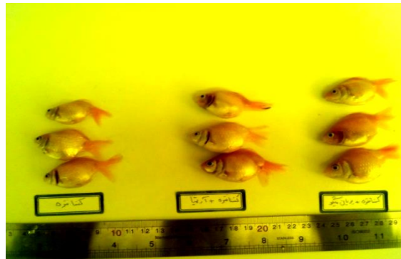
شکل ۱: ظاهر ماهیان آزمایش شده در تیمارهای مختلف از نظر میزان رشد در پایان دوره آزمایش

*حروف غیریکسان در یک بازه آزمون نشان دهنده اختلاف معنی دار تیمارها می باشد (P<۰/۰۵)