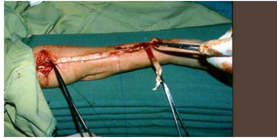
شکل ۶- در مواردی که هیچ نوع عضله برای فلکسیون انگشتان وجود نداشته باشد، انتقال تاندون عضله بای‌سپس به فلکسورهای انگشتان مطرح است. تصویر انتقال تاندون بای‌سپس به واسطه T.F.L. به فلکسورهای انگشتان را نشان می‌دهد.

بدینوسیله انقباض عضله بای‌سپس موجب فلکسیون انگشتان می‌شود (شکل ۷).