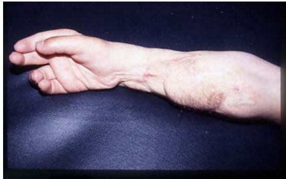
شکل ۱۳- باز شدن انگشتان بعد از عمل