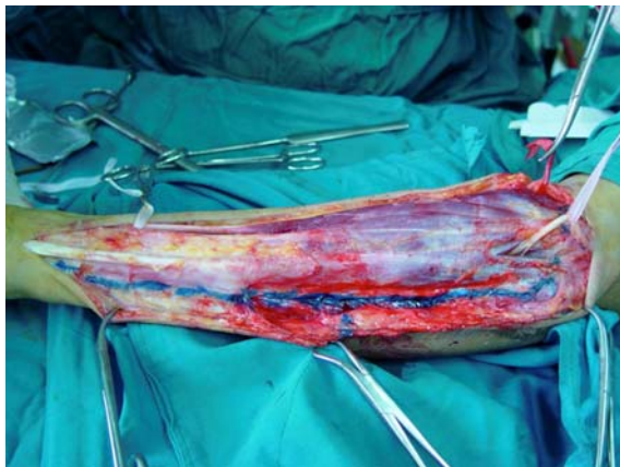
شکل ۱- برش پوست در قسمت داخلی ساعد از بالای آرنج تا مچ دست داده می‌شود (روش Scaglietti).

در صورتی که انگشتان مقداری حرکت داشته باشند، این روش به کار می‌رود. اصول آن جبران کوتاهی و کشش و کنتراکسیون عضلات فلکسور انگشتان با جلو کشیدن آنها از اتصالات بالایی است. ما برش پوست را در قسمت داخلی ساعد از بالای آرنج تا مچ دست می‌دهیم (شکل ۱). پوست و فاسیا تشریح و آزاد شده و بطرف بالا برده می‌شود، سپس تشریح عضلات از زیر پریوست استخوان کوبیتوس و سپس رادیوس شروع می‌شود.