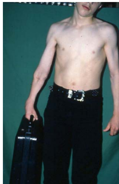
شکل ۱۲- قدرت فلکسیون انگشتان بعد از انتقال عضله به اندزه کافی می‌باشد و بیمار می‌تواند وزنه ۱۰ کیلویی را حمل کند.