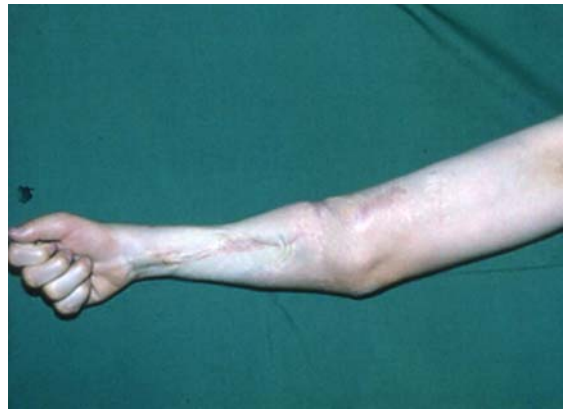
شکل ۱۱- فلکسیون انگشتان بعد از انتقال عضله لاتیسیموس دورسی

توزیع نتایج درمان بر حسب روش جراحی در جدول شماره ۲ ارائه شده است و نشان می‌دهد که در همه بیماران نتیجه عمل خیلی خوب تا خوب بود و نتیجه عمل غیر قابل قبول نداشتیم. بهترین نتیجه درمان در روش لاتیسیموس و در سطح خیلی خوب به میزان ۹۰/۹٪ بود و پس از آن روش Scaglietti به میزان ۷۱/۴٪ بود. این اختلاف در نتیجه درمان به روشهای مختلف از نظر آماری معنی‌دار بود ( p < 0/01 ).