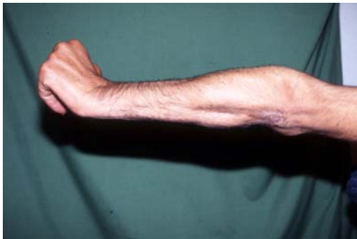
شکل ۹- فلکسیون انگشتان به اندازه کافی می‌باشد.