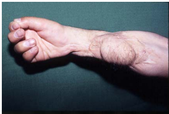
شکل ۱۴- فلکسیون انگشتان پس از انتقال عضله گراسیلیس به ساعد