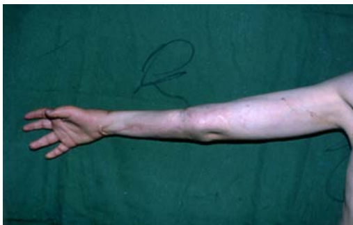
شکل ۱۰- تصویر، اکستانسیون انگشتان را بعد از انتقال عضله لاتیسموس دورسی نشان می‌دهد.