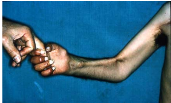
شکل ۷- تصویر فلکسیون انگشتان بعد از انتقال یک باندلت T.F.L. را نشان می‌دهد.