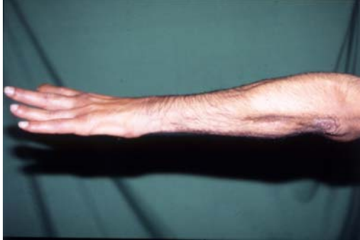
شکل ۸- تصویر بعد از عمل، انگشتان بخوبی باز می‌شوند.

چند ماه بعد از عمل بیماران توانستند وزنه ۱۰ کیلوگرمی را برداشته و جایجا کنند. تعداد ۲۲ بیمار را با این روش عمل کردیم و نتایج درمان در جدول شماره ۱ و ۲ ارائه شده است. این نتایج نشان می‌دهد که در ۹۰٪ موارد نتیجه عمل بسیار خوب بوده است (شکل ۱۰-۱۲).