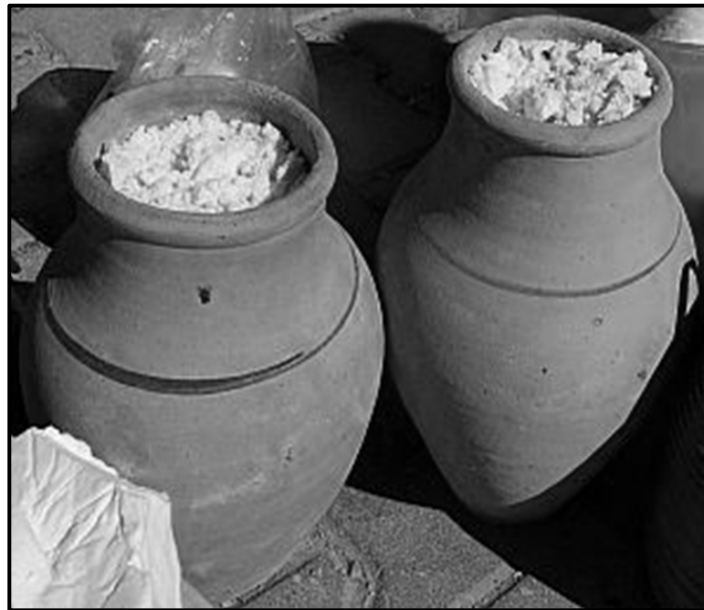
شکل ۱- پنیر کوزه آماده مصرف

(Urabach, 1995). سویه‌های بومی به طور معمول در فلور میکروبی شیر در منطقه تولید حضور دارند و از این طریق وارد روند تولید پنیر می‌شوند و در ایجاد عطر و طعم تأثیر بسزایی دارند (Fernandez-Garcia et al. , 2004).