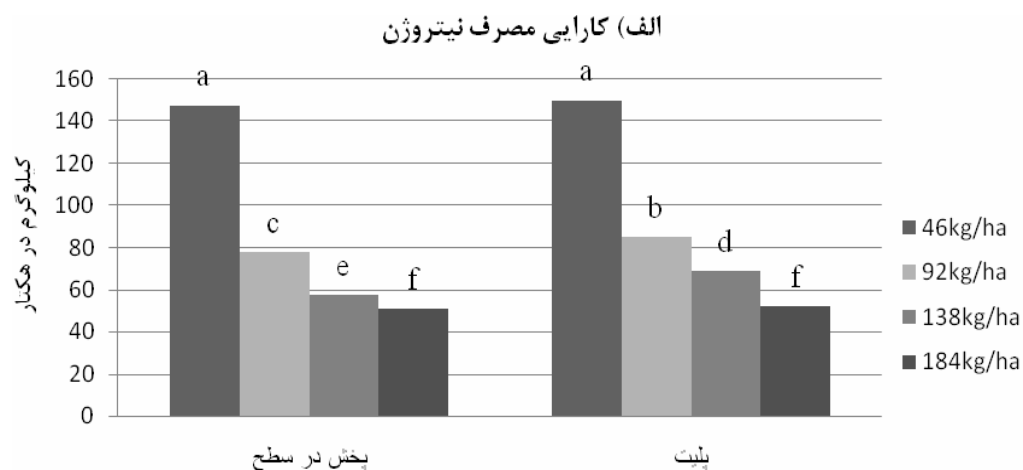
شکل ۱. مقایسه میانگین‌های، کارایی مصرف نیتروژن و کارایی زراعی

در هر ستون اعداد که حروف غیرمشترک دارند احتمال در سطح ۵ درصد دارای اختلاف معنی‌دار به روش دانکن هستند.