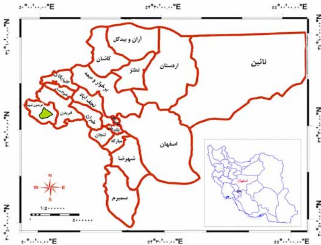
شکل ۱. موقعیت جغرافیایی منطقه مورد مطالعه