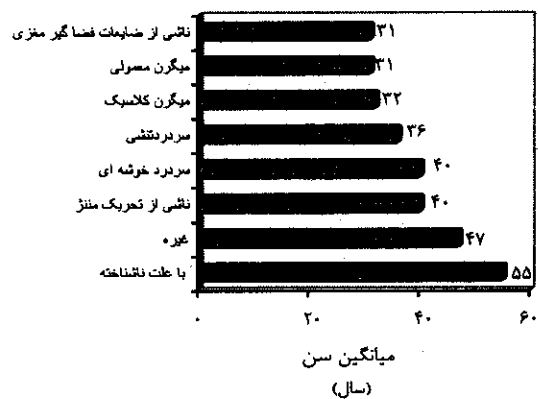
نمودار ۱: میانگین سنی در انواع سردرد در مراجعین به بیمارستان سینا همدان در سال ۱۳۷۷

سن بعنوان یکی دیگر از فاکتورها مورد بررسی قرار گرفت. متوسط سنی جامعه مورد مطالعه ۳۶ سال و انحراف معیار منحنی سن کل بیماران حدود ۱۶ سال می باشد. کمترین و بیشترین سن بیماران به ترتیب ۹ و ۸۰ سال بوده است (نمودار ۱).