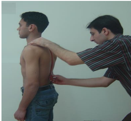
تصویر ۲- نحوه قرار دادن خطکش توسط اندازه‌گیرنده بر روی قوس کیفوز دانش‌آموز

تغییری روی کاغذ می‌گذاشت. سپس نقاط مشخص‌شده، روی کاغذ علامت زده و انحنای خطکش به‌وسیله یک مداد روی کاغذ، رسم می‌شد. خطکش منعطف، از روی کاغذ برداشته و از دو نقطه مشخص‌شده T2 به T12، خطی مستقیم رسم شد. طول خط واصل بین زوایند شوکی مذکور، اندازه‌گیری و با حرف "l" نامگذاری شد. سپس فاصله عمیق‌ترین نقطه قوس از خط l، به‌عنوان عرض قوس ( h ) اندازه‌گیری شد و با قرار دادن مقادیر در فرمول مربوطه ( \theta = 4 \text{ Arctang}(\frac{h}{l}) )، زاویه حاصل از انحنای خطکش منعطف برای قوس مهره‌های پشتی محاسبه گردید (۱۶ و ۱۷). خلخالی و همکاران، میزان همبستگی r=0.89 بین روش خطکش منعطف با روش معیار (رادیوگرافی) برای اندازه‌گیری کایفوز سینه‌ای به‌دست آوردند. از همین روش در تحقیق حاضر استفاده شده است.