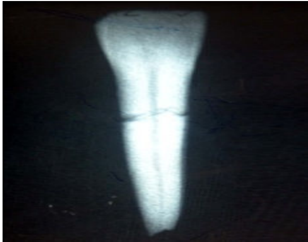
شکل ۱- نمای رادیوگرافیک نمونه شماره ۱ در حالت دندان به تنهایی

دندان‌ها شماره‌گذاری شد و از هر دندان دو رادیوگرافی به عمل آمد. رادیوگرافی اول فقط از دندان و با زاویه عمود بر محور طولی دندان و زمان اکسپوژر ۰/۱۲ ثانیه و رادیوگرافی دوم درحالی‌که زاویه دندان و تیوپ رادیوگرافی ثابت بود با اضافه کردن قطعه‌ای از استخوان مندیبل انسان به ضخامت ۲/۵ سانتی‌متر، با همان زاویه قبلی و با زمان اکسپوژر ۰/۱۶ ثانیه به عمل آمد. بدین ترتیب برای هر دندان، زاویه تیوپ اشعه و دندان ثابت و تنها تفاوت، در اضافه شدن استخوان مندیبل و تغییر متناسبی در میزان اشعه ایکس بود. بنابراین دو دسته رادیوگرافی به دست آمد، دسته اول رادیوگرافی‌هایی بودند که از "دندان به تنهایی" و دسته دوم رادیوگرافی‌هایی بودند که از "دندان به همراه استخوان" به عمل آمده بود (اشکال ۱ و ۲).