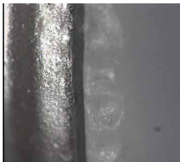
شکل ۴- تصویر تهیه شده از لبه کور و مدل آزمایشی توسط استریومیکروسکوپ