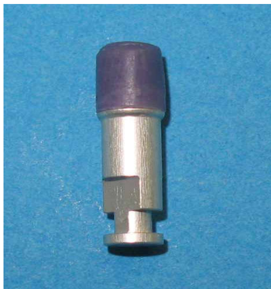
شکل ۲- مدل مومی finish شده روی مدل آزمایشی

درنهایت، مدل مومی روی مدل آزمایشی توسط یک برنیشر finish شد (شکل ۲).