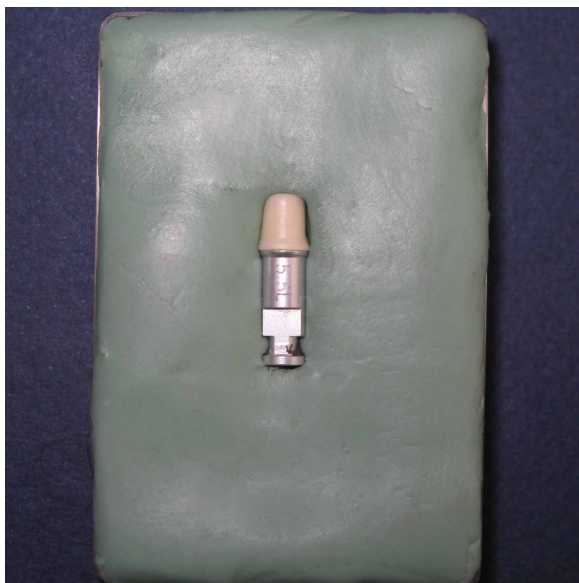
شکل ۳- قرارگیری مجموعه کور و مدل آزمایشی به صورت افقی در ایندکس پوتی

Speedex استفاده شد. یکی از کوره‌های ساخته شده روی مدل آزمایشی قرار گرفته و این مجموعه به صورت افقی از یکی از ۴ وجه