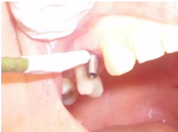
شکل ۲- باقیمانده طول سنسور با عایق مخصوص سیستم پوشانده شد و از اباتمنت سوراخ شده عبور می‌کند

قسمت سرویکال فضای داخل آن قرار داشته باشد، سنسور در خارج از دهان بیمار، یک بار از روی اباتمنت اندازه‌گیری شده و یک بار دیگر نیز، از داخل سوراخ تعبیه شده اباتمنت متصل به یک نمونه ایمپلنت عبور داده و اندازه‌گیری شد. هنگام آزمایش روی بیمار، سنسور از داخل اباتمنت ایمپلنت عبور کرده و اگر تا علامتی که قبلاً روی سنسور پیش‌بینی شده بود، داخل اباتمنت متصل به ایمپلنت قرار می‌گرفت، محل صحیح سنسور تأیید می‌شد (شکل ۲). سپس باقیمانده طول سنسور با عایق مخصوص سیستم پوشانده شد. هنگام انجام آزمایش اباتمنت بدون پیچ قرار داده شد و دسترسی پیچ در سطح فوقانی اباتمنت توسط ماده پانسمان سیل شد برای اطمینان کامل از دقت سنسور اصلی متصل به دستگاه ترمومتر آزمایشات زیر انجام شد.