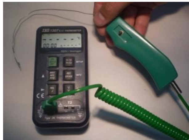
شکل ۱- دستگاه ترمومتر TES مدل 1307 Datalogging Thermometer و ترمومترهای استاندارد از نوع J-type

شاخص‌های آناتومیک وارد مطالعه شدند. برای انجام درمان، از ایمپلنت‌های Tissue level سیستم ایمپلنت (Cowellmedi Co. Ltd, South Korea) ساخت کره جنوبی استفاده شد و به منظور ثبت تغییرات حرارتی نیز از دستگاه ترمومتر TES مدل 1307 Datalogging (TESElectric Corp, Taiwan) Thermometer و سنسورهای ترمومتر استاندارد از نوع J-type استفاده شد (شکل ۱).