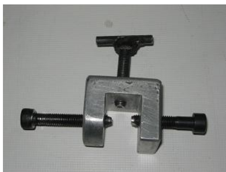
شکل ۳- گیره مخصوص نگهداری بیس آکریلی