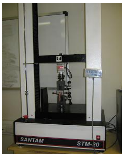
شکل ۲- دستگاه UTM