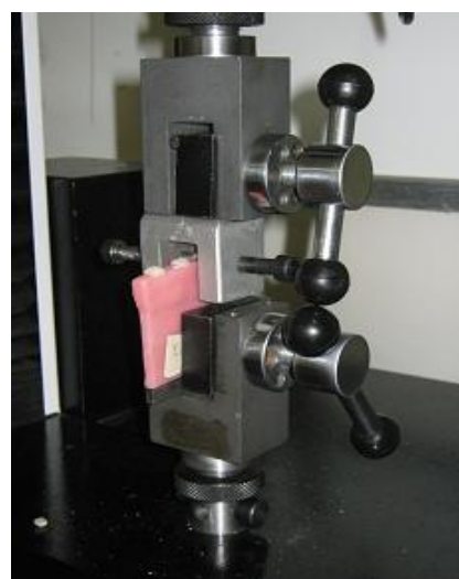
شکل ۱- تصاویر لوازم مورد نیاز برای آزمایش باندینگ توسط استاندارد

(Silane, 3M ESPE, US) و به دسته دوم مونومر (Monomer, Dental Industry, IRAN Acrylic, Iran Polymer) زده شد. عملیات مغل‌گذاری و پخت روی آن‌ها انجام شد و دندان‌ها به آکریل (Iran Acrylic Polymer, Dental Industry, Iran) متصل گردیدند. پس از حذف آکریل‌های اضافی و پرداخت نمونه‌ها، اتصالات هر یک از دندان‌ها به بیس آکریلی‌شان با دقت کنترل شد و در صورت بی‌نقص بودن محل چسبندگی دندان‌ها با بیس آکریلیشان برای آزمایش انتخاب شدند. تست کشش این نمونه‌ها توسط دستگاه (SANTAM STM-20, (UTM) Universal Testing Machine (Iran) انجام شد (شکل ۲). هر یک از نمونه‌ها به فک (گیره) (شکل ۳) دستگاه کشش ثابت شده و از طرف دیگر در جهت مخالف آن تحت تأثیر نیروی کششی توسط قلابی (شکل ۴) که فقط در لبه اینسوزالی دندان درگیر بود، با سرعتی معادل ۱ میلی‌متر بر دقیقه قرار داده شد تا زمانی که دندان در اثر نیروی وارده شکسته و یا از بیس خود خارج شد (شکل ۲). نیرویی که باعث شکست گردید، ثبت و برای تحلیل نتایج از آن‌ها استفاده شد. براساس استاندارد، جواب مثبت آزمایش هر یک از نمونه‌ها زمانی است که خود دندان و یا آکریل بیس نگهدارنده دندان بشکند ولی محل اتصال دندان با بیس آکریلی‌شان نیروی وارده را تحمل کند. جواب منفی زمانی است که محل اتصال دندان با بیس آن تحمل نیروی کششی وارده را ندارد و دندان از جایگاه خود به طور کامل خارج شود. بعد از انجام این آزمایش برای کلیه