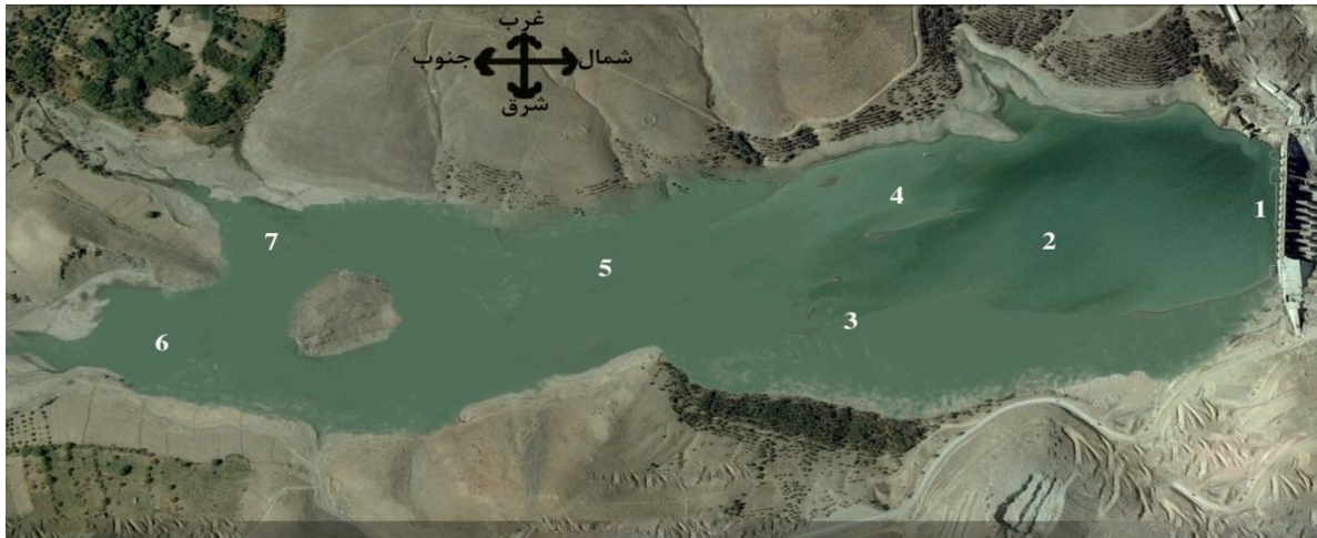
شکل ۱: نقشه ماهواره ایی دریاچه و موقعیت ایستگاه های نمونه برداری [۱۰]