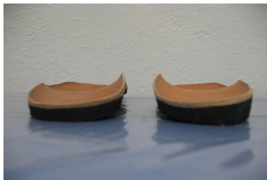
شکل 1- تصویر کفی با گوه خارجی - سمت راست، کفی بدون گوه - سمت چپ

در این پژوهش از کفی با جنس اتیل ونیل استات با دانسیته بالا با رویه چرمی و 5 درجه گوه خارجی استفاده شد (شکل 1) (27). گوه آن در کل طول لبه خارجی پا گسترده بود (13, 30) کفی با گوه خارجی با اندازه مناسب برای هر بیمار آماده می‌شد. در یک موقعیت، کفی با گوه خارجی توسط استرپ ساب تالار زیر پای فرد قرار گرفت (شکل 2). همچنین کفی، در موقعیت بدون استرپ ساب تالار، توسط نوار نئوپرنی و ولکرو زیر پای مبتلای فرد قرار داده شد (20). در هر سه موقعیت، فرد در منزل کفش ژیمناستیک می‌پوشید. به منظور حفظ تقارن راه رفتن یک کفی بدون گوه هم در اندام مقابل توسط نوار نئوپرنی و ولکرو استفاده شد (13). از افراد خواسته شد تا کفی با گوه خارجی با و بدون استرپ ساب تالار را در منزل به مدت 5 تا 10 ساعت در روز به مدت 4 هفته بپوشند (31). بعد از هفته چهارم همه بیماران پرسشنامه KOOS را مجدداً تکمیل کردند.