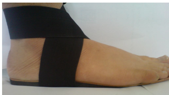
شکل 2- تصویر کفی با گوه خارجی و استرپ ساب تالار قرار گرفته در زیر پای فرد

به منظور تجزیه و تحلیل اطلاعات، برای مقایسه میانگین‌ها در هر گروه قبل و بعد از درمان از آزمون تی زوجی و مقایسه میانگین‌ها بین گروه‌ها قبل و بعد از درمان از آزمون تی