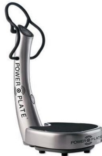
شکل ۱- دستگاه Whole Body Vibration

تعداد 40 خانم سالم با میانگین سنی 24 \pm 1/87 سال، قد 1/62 \pm 0/048 متر، وزن 54/7 \pm 7/08 کیلوگرم و شاخص توده بدنی 20/88 \pm 2/29 در این مطالعه شرکت کردند. میانگین (انحراف معیار) زمان عکس العمل در گروه ویبراسیون روشن، قبل از مداخله 353/02 (119/79) میلی ثانیه بود، در حالیکه این